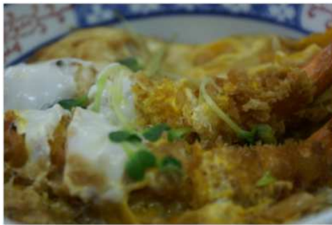
「かまくら井 並」は1100円。えびフライとトンカツの両方がのっている「よくばり井」も人気メニューのひとつ。

されており、高齢のため数年前に閉店されました。以後は『長兵衛 長谷駅前店』としていた店名を『長兵衛』のみにしているとのことです。お店の定休日は特になく、ほぼいつも開店しています。年間に14日ほど休みをとるくらいだそうです。お客様は、インターネットなどで予め「かまくら井」の情報を調べてお越しになる学生さんたちやガイドブックをみて来店する外国の観光客の方も多そうです。長谷の玄関口の食事処は、鎌倉で代々培ったフライの味で毎日鎌倉らしいおもてなしをしています。