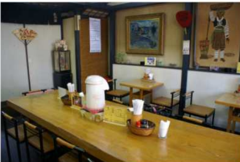
昔ながらの食堂らしさで観光客をのんびりと落ち着かせてくれる店内